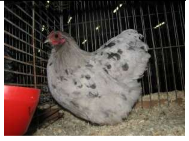
Beyaz siyah kolombiya